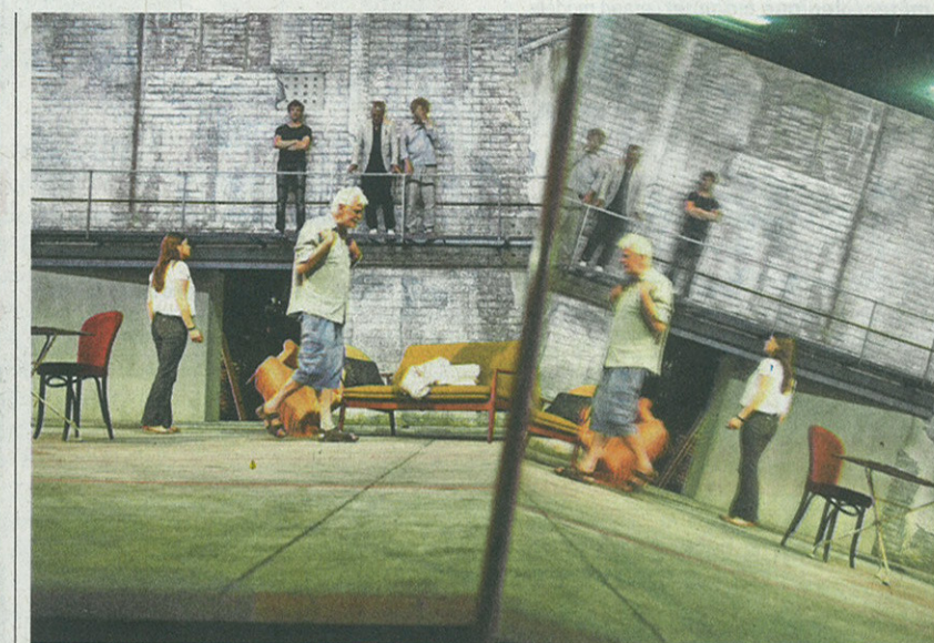
Krystian Lupa en répétition de Perturbation, de Thomas Bernhard.

Monthey La salle valaisanne propose toujours de belles surprises. C'est encore le cas cette année avec Berthollet , une adaptation de la nouvelle de Ramuz par la Cie Mufuthe, du 26 sept. au 20 oct. Mais le Crochetan ne dédaigne pas les stars et s'offre le 4 octobre un Guy Bedos dont on pensait qu'il était déjà à la retraite. Rens.: 024 471 62 67 www.crochetan.ch